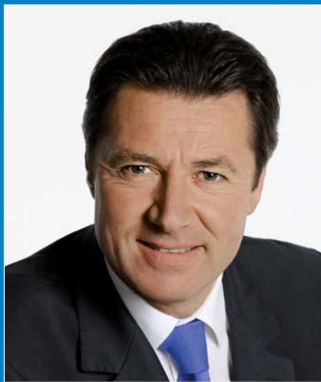
Christian ESTROSI Ministre chargé de l'Industrie Maire de Nice Président de Nice Côte d'Azur